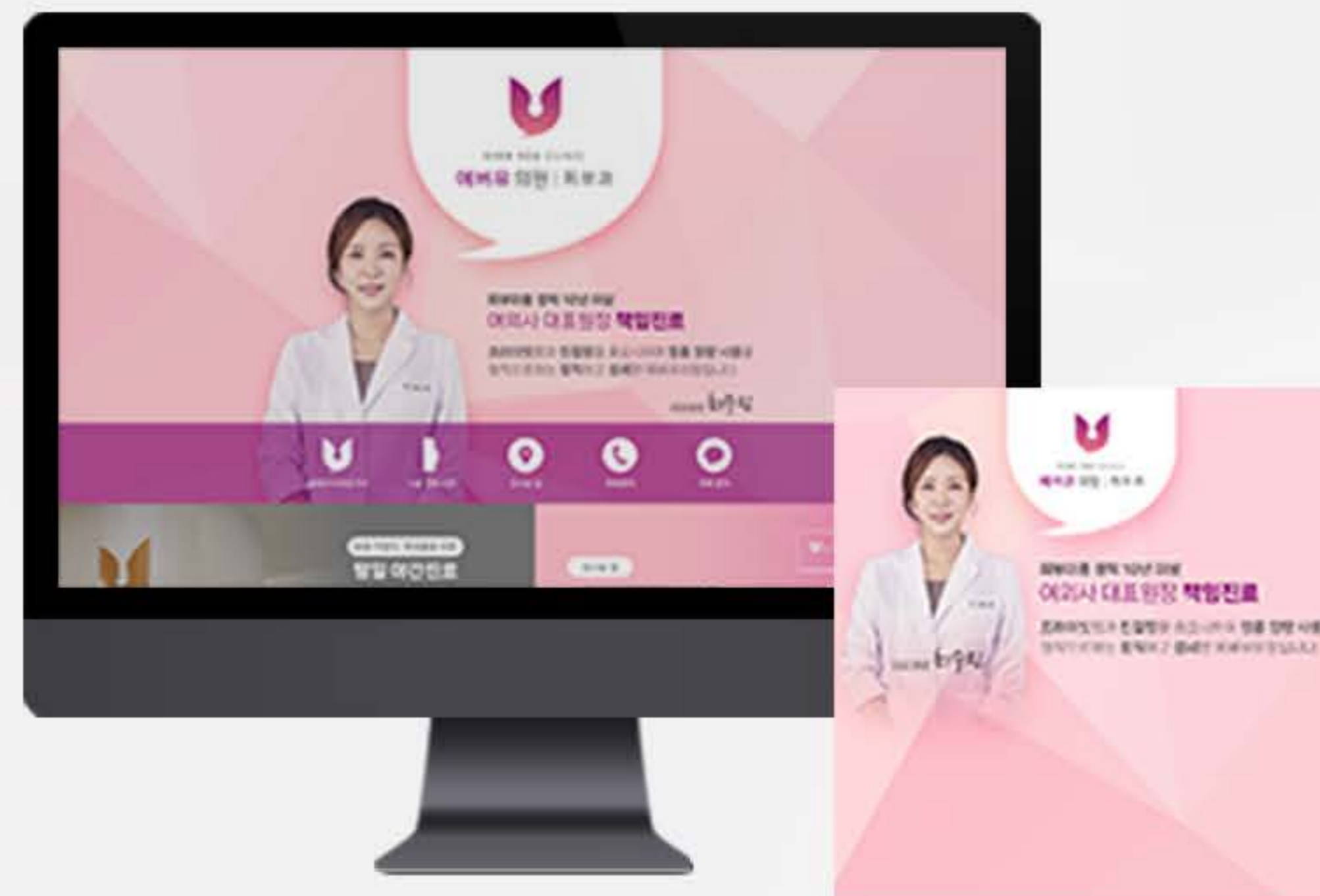
• 서울 (마포) 병원 블로그스킨 세팅 사례