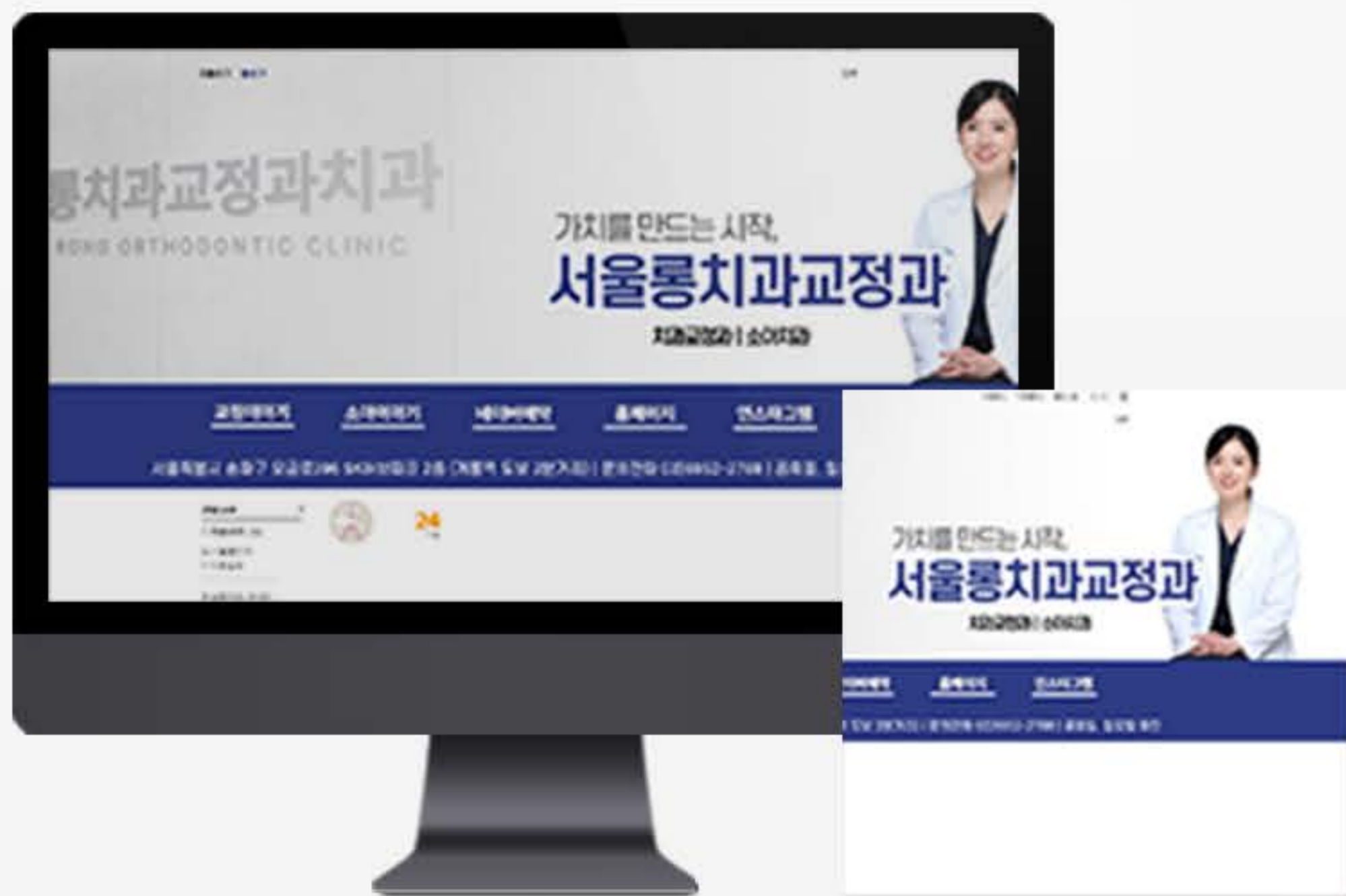
• 서울 (송파) 병원 블로그스킨 세팅 사례