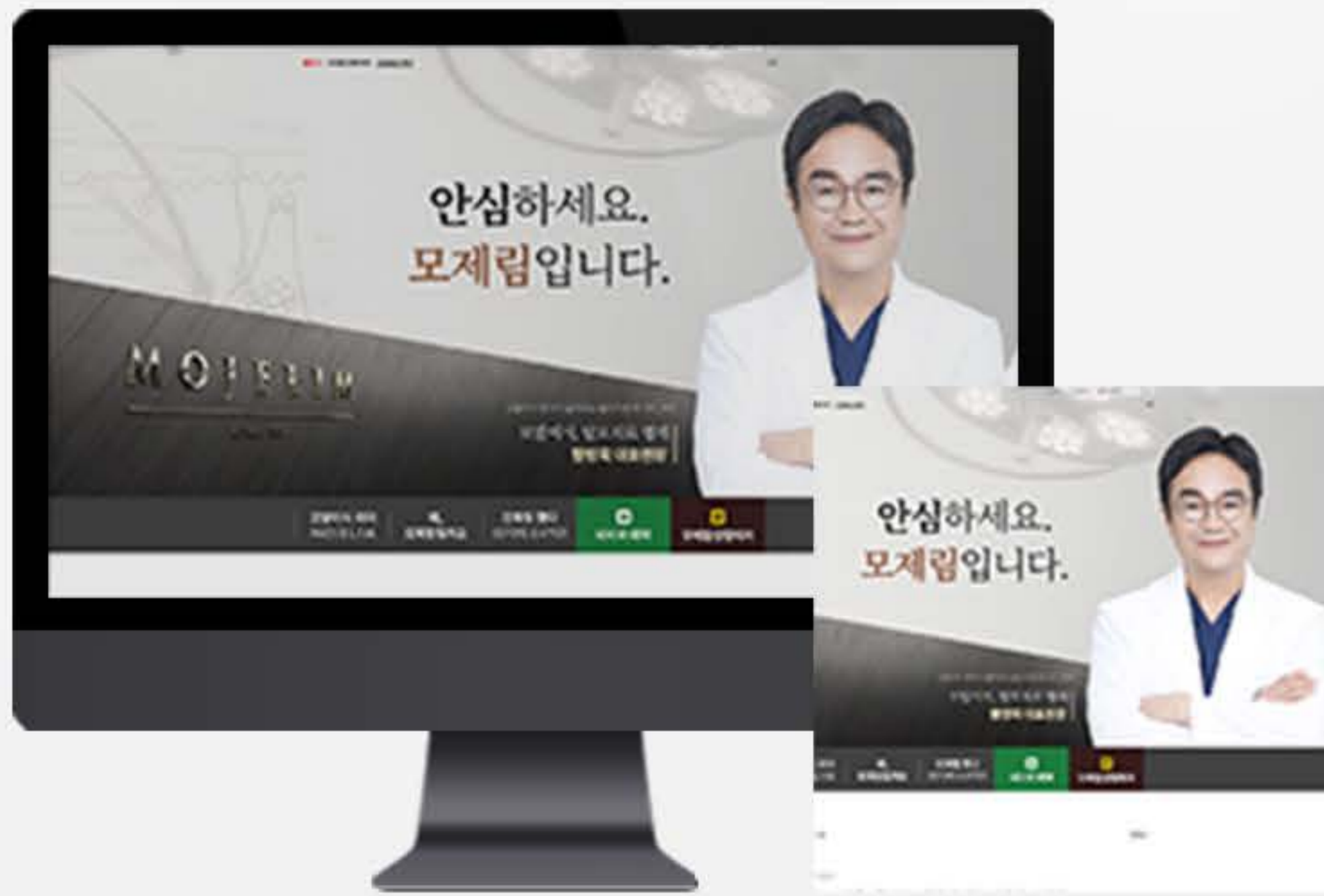
• 서울 (강남) 병원 블로그스킨 세팅 사례