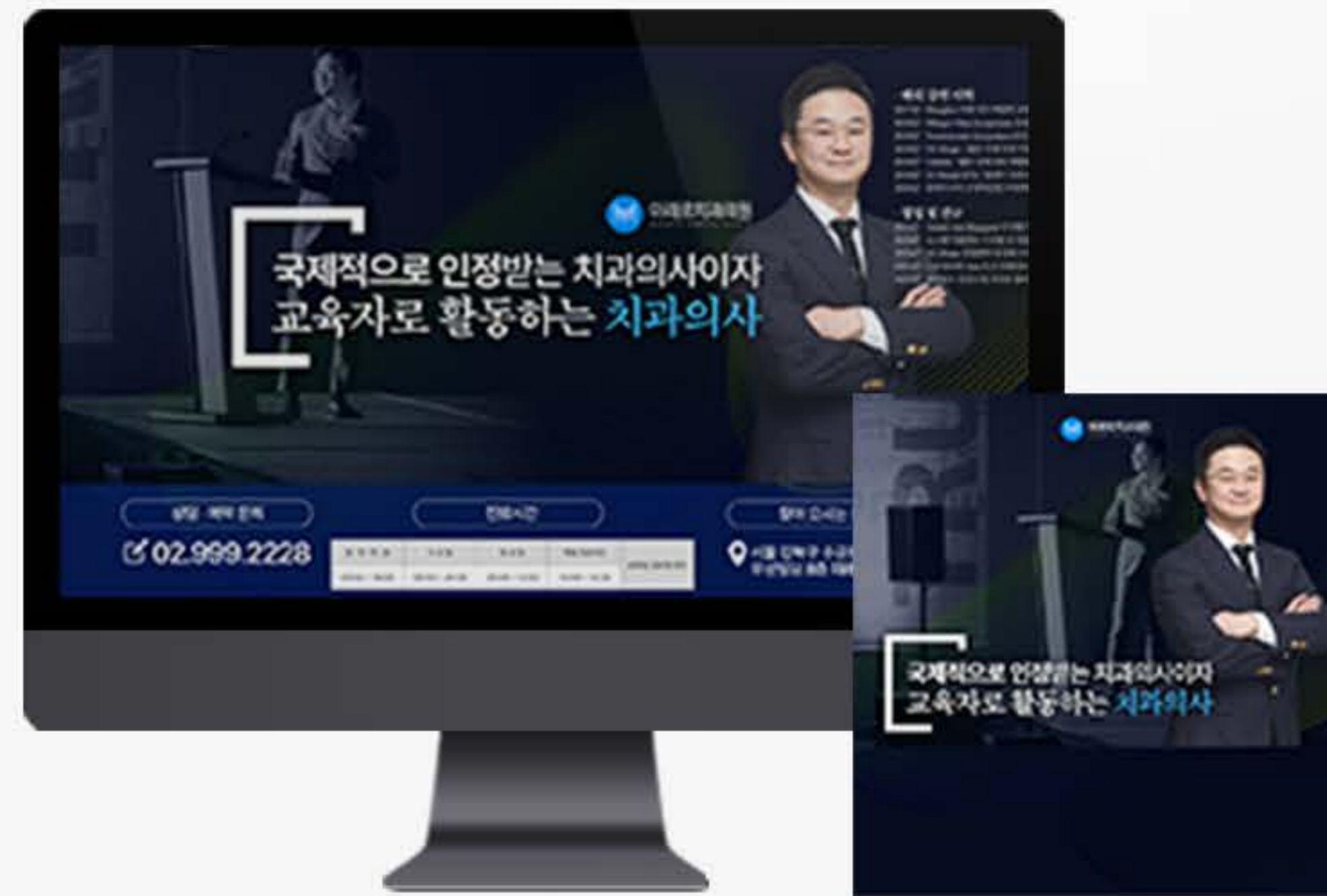
• 서울 (강북) 병원 블로그스킨 세팅 사례