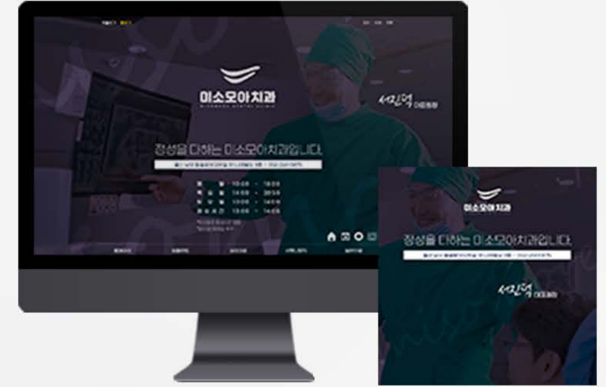
• 울산병원 블로그스킨 세팅 사례