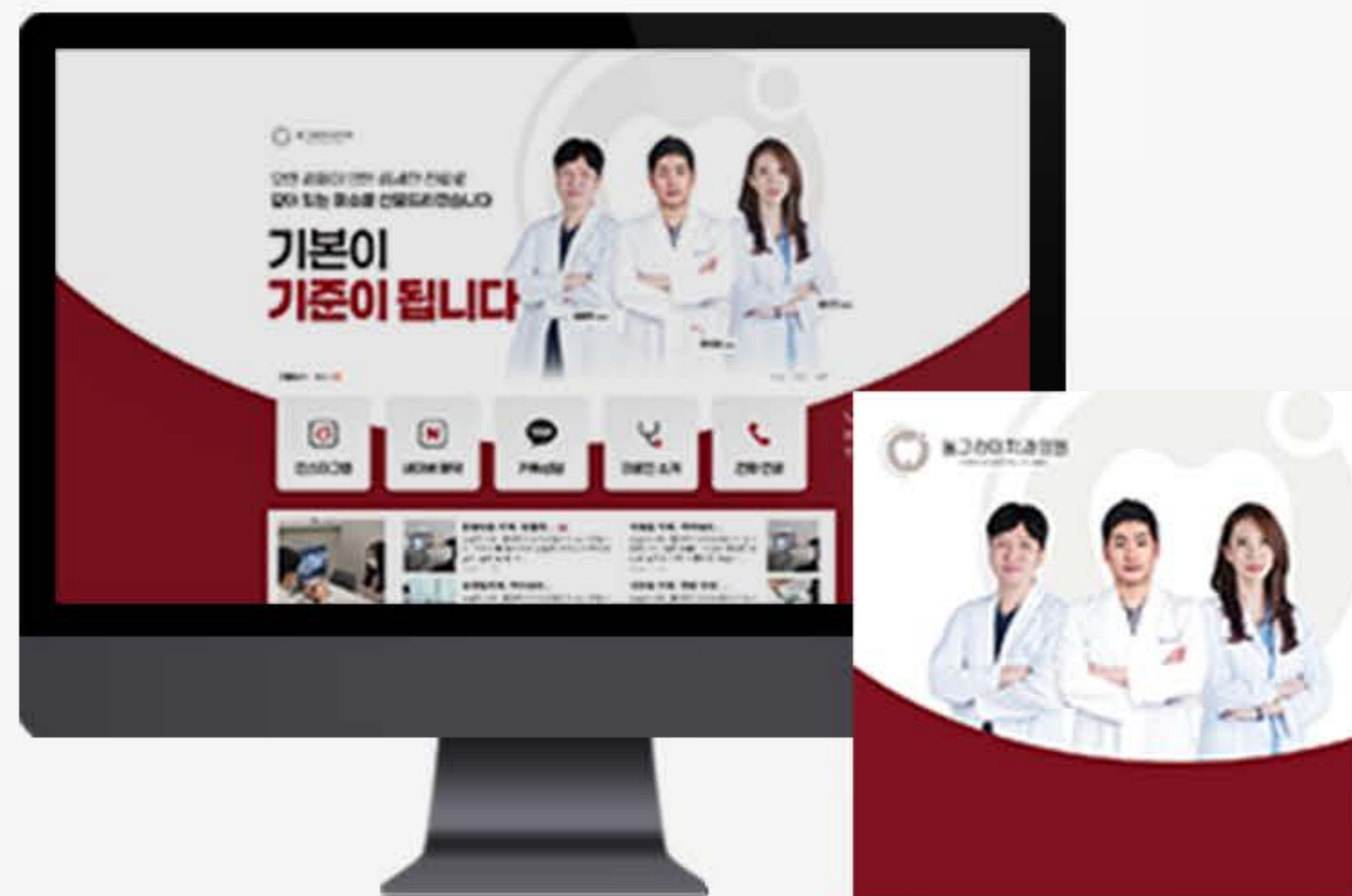
• 고양 블로그 병원 스킨 세팅 사례