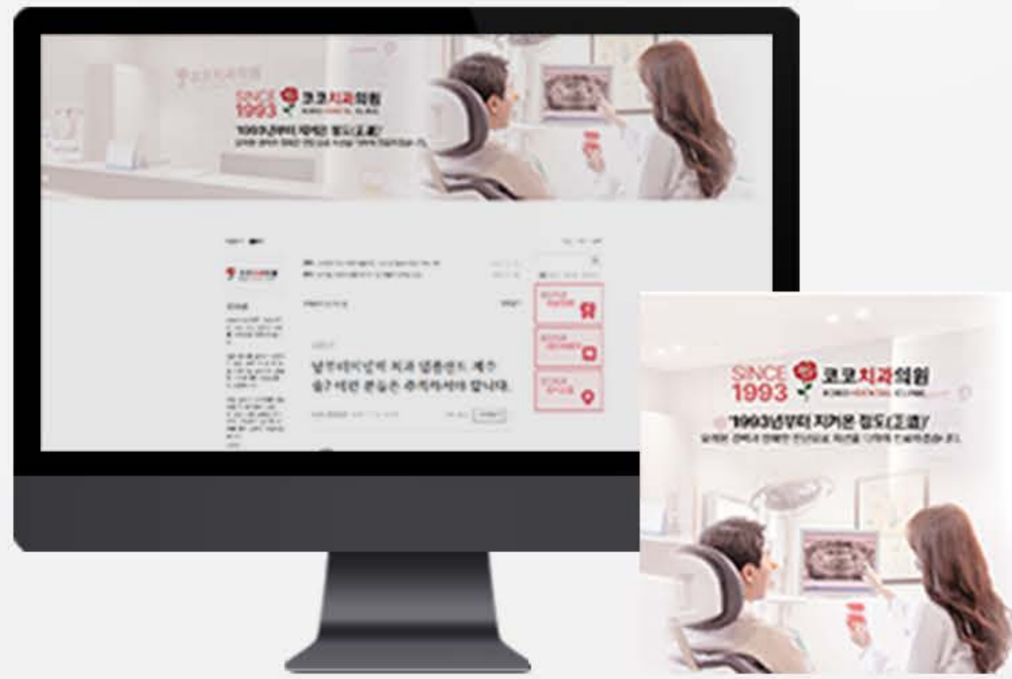
• 서울 (강남) 병원 블로그스킨 세팅 사례