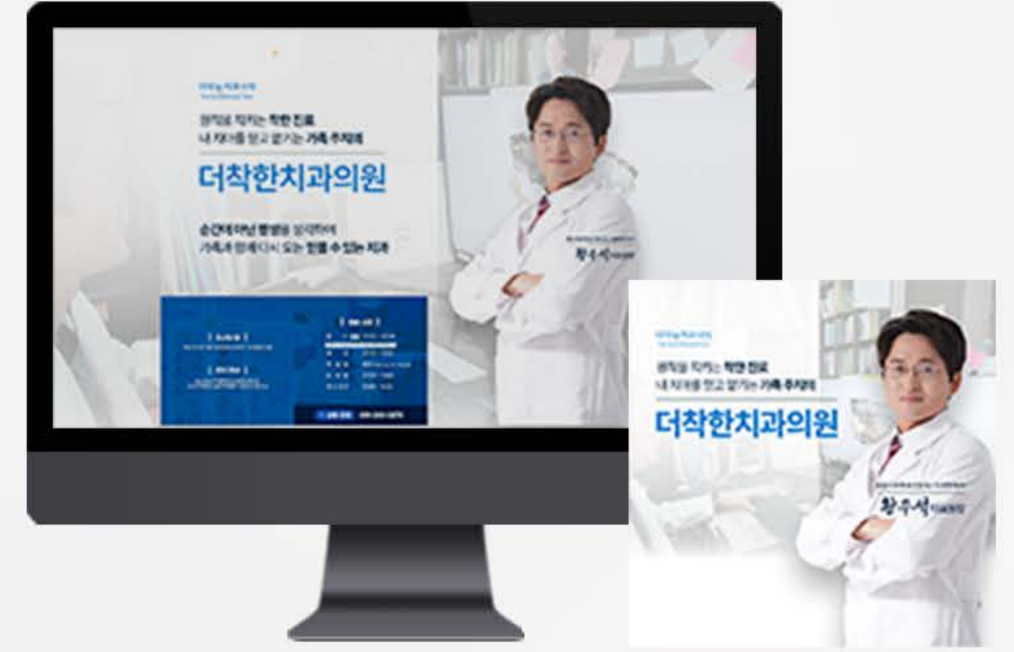
• 부산 병원 블로그스킨 세팅 사례